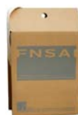
Flexo 1 couleur