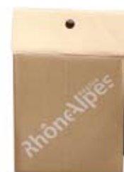
Flexo 1 couleur