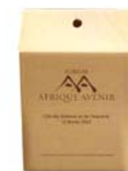
Flexo 1 couleur