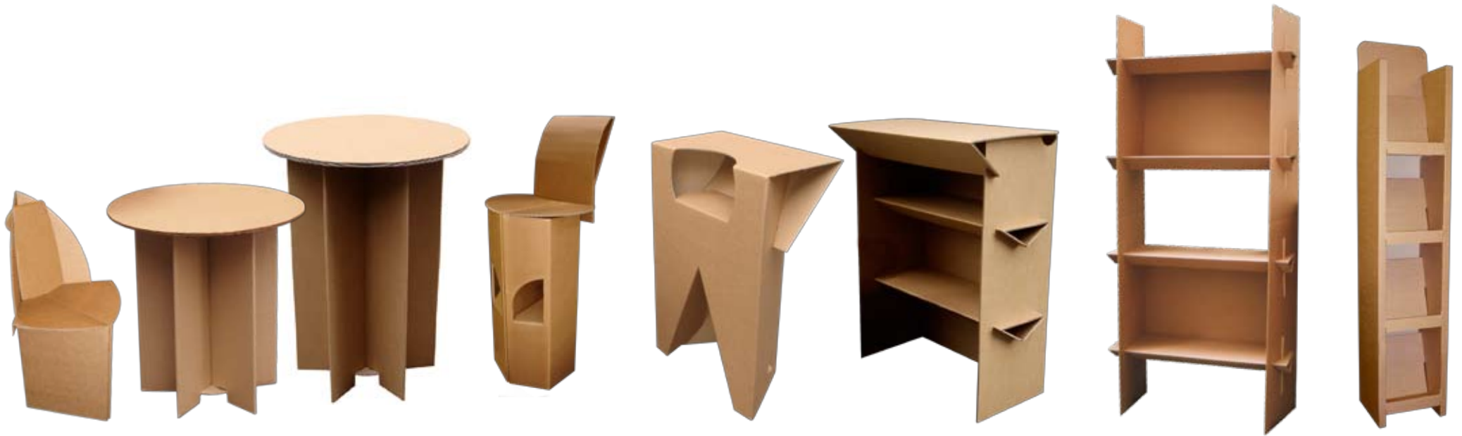
Table "Étoile" est composée d'un plateau double épaisseur vernis, d'un piètement radial en étoile et d'un disque de verrouillage situé à la base.

Tous nos mobiliers sont de fabrication française. Ils sont réalisés en simple ou double cannelure à partir de fibres 80% recyclées et sont 100% recyclables. Tous sont emballés à plat en plaques pré-pliées pour des frais de conditionnement et de transport réduits. Aisément montables et démontables par emboîtement, ils sont réutilisables. Leur manipulation est sans danger grâce à des découpes dentelées par filets anti-coupe. Les tables sont imperméabilisées à l'aide d'un vernis alimentaire à base d'amidon de riz.