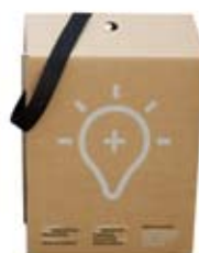
Flexo 2 couleurs