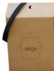
Flexo 1 couleur