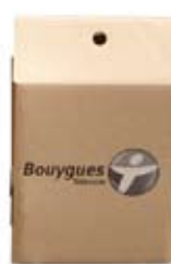
Flexo 2 couleurs