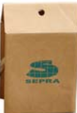
Sérigraphie 1 couleur