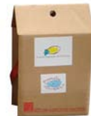
Adhésifs fond blanc